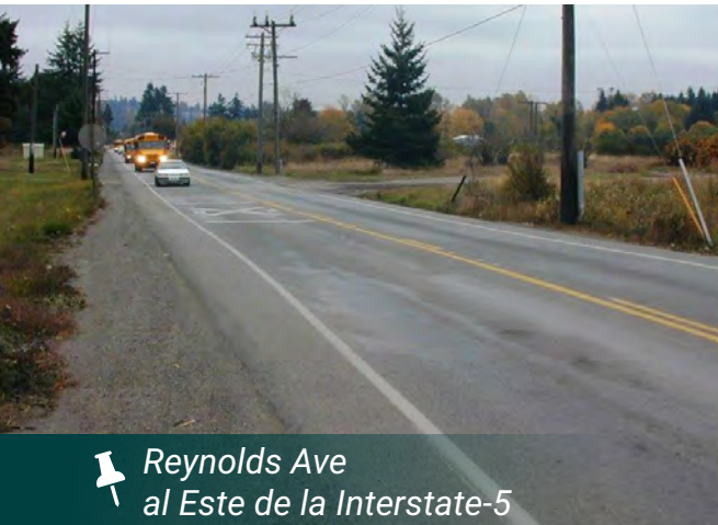
Reynolds Ave al Este de la Interstate-5

El corredor ya no satisface las necesidades actuales de nuestra comunidad en crecimiento porque falta infraestructura crítica como aceras y carriles para bicicletas y debe ampliarse para apoyar nuestro crecimiento de población previsto. Las mejoras ayudarán a las personas a tener acceso a las empresas y hogares locales de forma segura al caminar, andar en bicicleta o conducir, mientras iluminan la carretera y embellecen la zona.