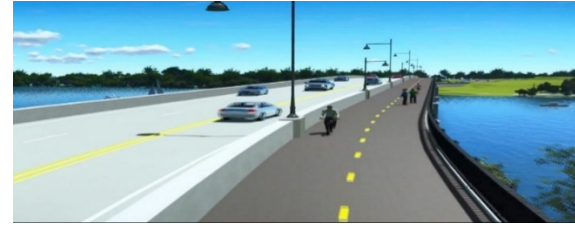
(Etapa 2: Representación conceptual)

Estas mismas secciones transversales de mejora se utilizarán para evaluar los costos del Enlace Norte del corredor del Conector del Lado Oeste entre Galvin Road y la intersección de Ives Road / Harrison Avenue en la Etapa 2.