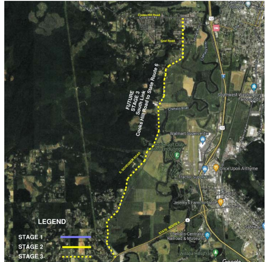
Etapa 3 - Mejoras futuras - SR 6 a Cooks Hill Road

Enlace Norte: Galvin Road a Ives Road / Intersección de Harrison Avenue