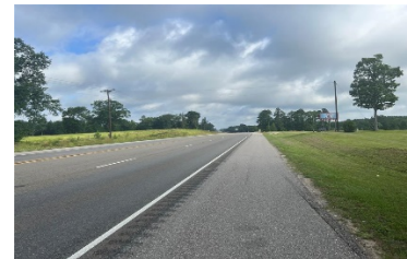
(Representación conceptual de el enlace del Sur)

El trabajo futuro de la Etapa 3 consistirá en evaluar las alineaciones horizontales y verticales del futuro enlace sur del corredor del Conector Westside (S. Scheuber Road – entre la Ruta Estatal 6 y Cooks Hill Road) para evaluar mejor el derecho de paso futuro y los costos de construcción necesarios para la mejora de los enlaces norte y sur del corredor Westside Connector.